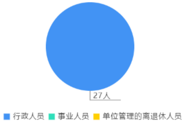
人员情况构成饼图

截止上年底，本单位人员编制28人，其中行政编制27人，事业编制0人；实有人员27人，其中行政27人，事业0人。单位管理的离退休人员0人。